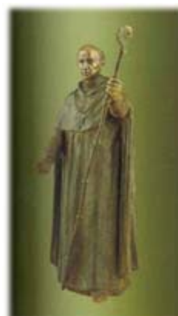
Estatua policromada que representa a Don Vasco de Quiroga.

El día 1o. de mayo de 1543, Carlos I de España expidió una Cédula Real en la que aceptaba asumir el patronazgo del colegio, con lo que a partir de esa fecha pasaba a ser el Real Colegio de San Nicolás Obispo.