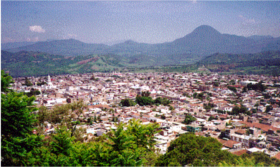
Vista panorámica de la ciudad de Morelia, Michoacán.